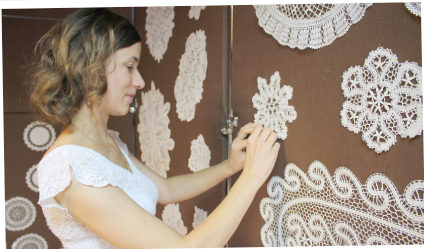
Centrum Kultury i Promocji Gminy Bobowa Opieka nad ekspozycją koronki klockowej