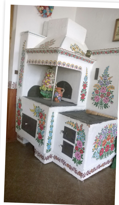
Gminny Ośrodek Kultury Oleśno z siedzibą w Zalipiu