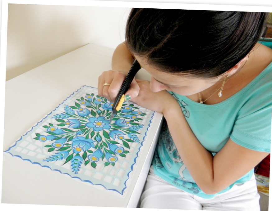
Gminny Ośrodek Kultury w Zalipiu Wycinanie ozdób kwiatowych