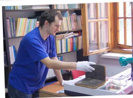
Diecezjalny Ośrodek Kultury Prawosławnej ELPIS Gorlice Segregacja, skanowanie i porządkowanie zbiorów w bibliotece w Ośrodku Elpis

Uczestnicy projektu podczas prezentacji eksponatów