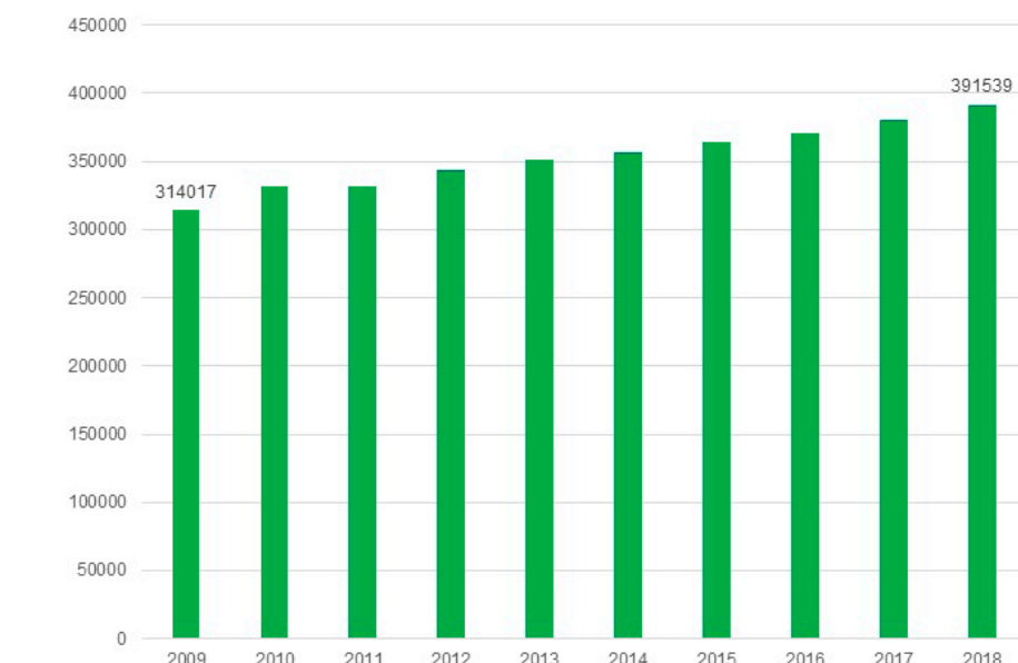
Podmioty gospodarki narodowej w rejestrze REGON w województwie małopolskim w latach 2009-2018 (stan na koniec grudnia)

Warto zwrócić uwagę też na branżę przemysłów kreatywnych, która uznawana jest za jedną z siedmiu małopolskich inteligentnych specjalizacji regionalnych i ważny czynnik rozwoju gospodarczego. Jak wynika z analiz Małopolskiego Obserwatorium Rozwoju Regionalnego, działalność w branży przemysłów kreatywnych generuje ok. 5,0-6,3% całego PKB w Małopolsce. Co warto podkreślić, 98% wszystkich podmiotów w tym sektorze tworzą mikroprzedsiębiorstwa zatrudniające do 9 osób.