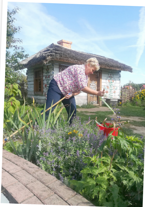
Dom Malarek w Zalipiu Pielęgnacja rabaty kwiatowej