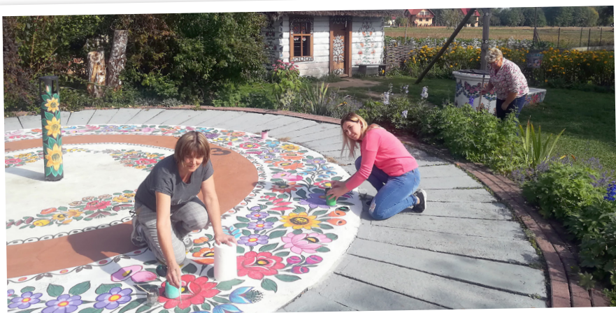
Dom Malarek w Zalipiu Konservacja motywów kwiatowych