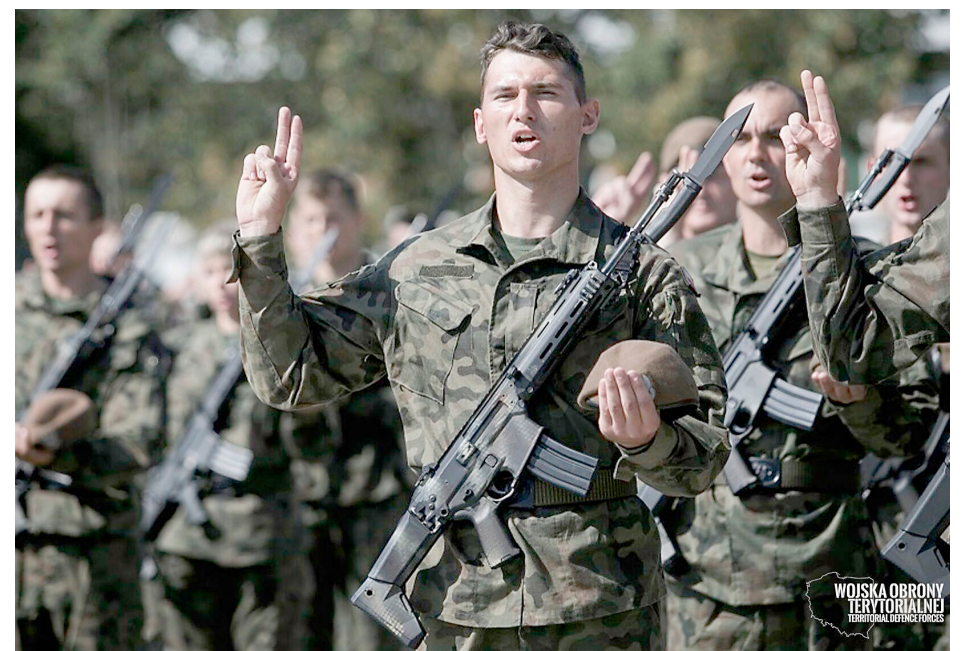
Przysięga żołnierzy Wojsk Obrony Terytorialnej