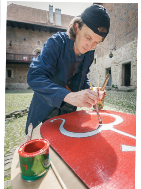
Konserwator w Zamku w Dębnie w Muzeum Okręgowym w Tarnowie