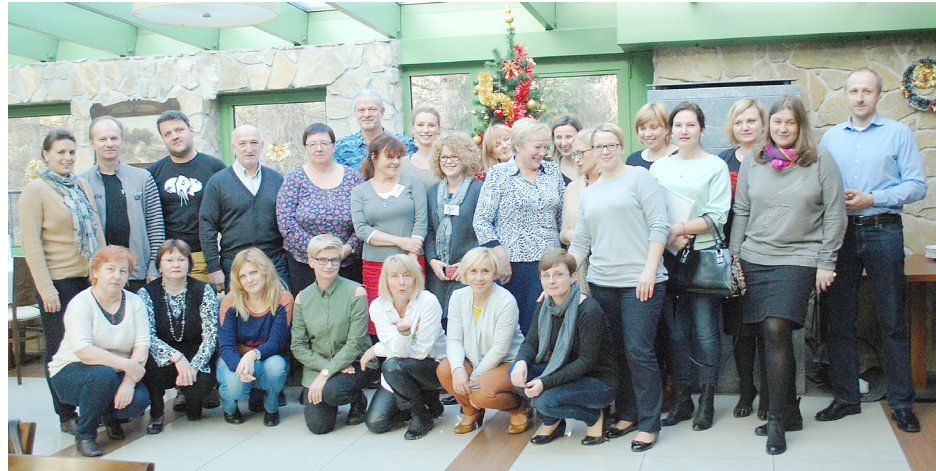
Wolontariusze projektu „50+ dojrzały, potrzebni, kompetentni”

Osoby, które nie mają zatrudnienia, a chciałyby je podjąć w branży budowlanej, mają możliwość uzyskania lub uaktualnienia kwalifikacji niezbędnych do pracy oraz zdobycia doświadczenia zawodowego. Równocześnie program jest inicjatywą odpowiadającą na potrzeby przedsiębiorców działających w branży budowlanej, którzy zgłaszają problemy ze znalezieniem pracowników.