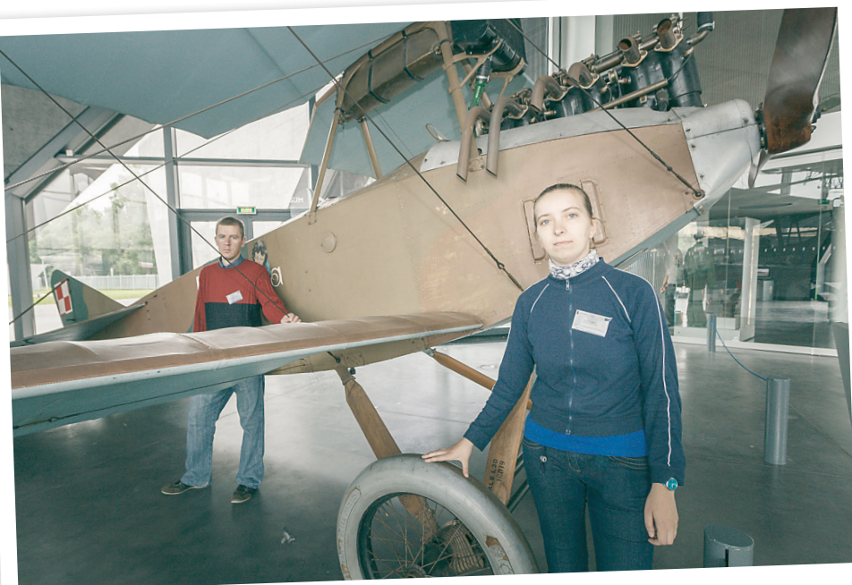
Muzeum Lotnictwa Polskiego w Krakowie

Uczestnicy projektu podczas prezentacji eksponatów