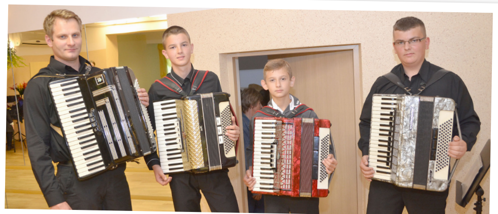
Gminny Ośrodek Kultury w Rzepienniku Strzyżewskim z siedzibą w Rzepienniku Suchym Kwartet akordeonowy założony przez uczestnika projektu