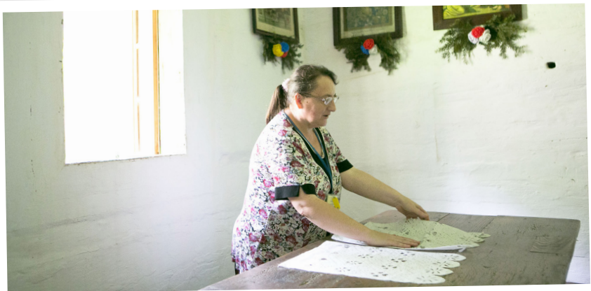
Muzeum Okręgowe Nowy Sącz Opieka nad koronkami

„Konservator” jest realizowany w naszym ośrodku nieprzerwanie od 2011 roku. Dzięki niemu przez 8 lat tymczasowe zatrudnienie znalazło kilkadziesiąt osób. Daje on uczestnikom możliwość zdobycia nowych umiejętności oraz poprawia ich sytuację materialną. Osoby, które brały udział w programie „Konservator”, dzięki zaangażowaniu pracowników Domu Malarek, zdobyły umiejętność malowania zalipskich motywów kwiatowych. Biorą one również udział w corocznym konkursie „Malowana Chata”. „Konservator” jest przede wszystkim wielkim wsparciem dla Domu Malarek, podtrzymuje tradycje oraz rozwija sztukę ludową Zalipia. Program uatrakcyjnia region zarówno pod względem etnograficznym, jak i turystycznym.