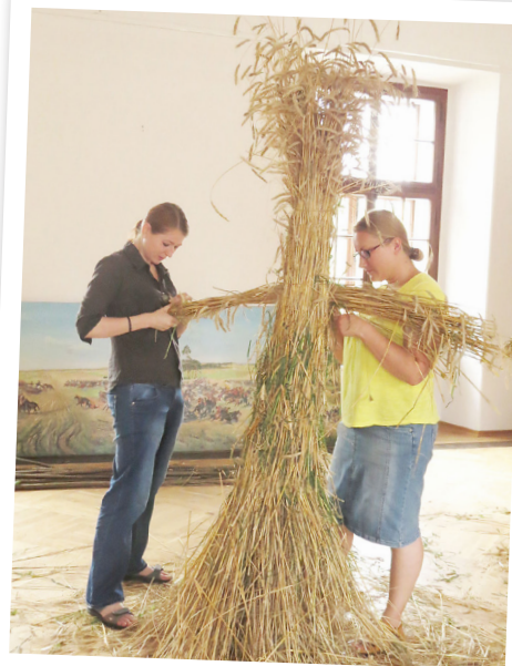
Muzeum Ziemi Miechowskiej Przygotowanie wystawy czasowej – aranżowanie wystawy

Uczestnicy projektu podczas prezentacji eksponatów